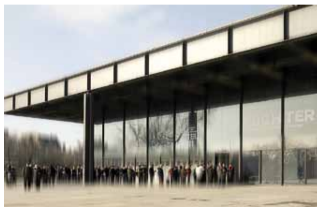
> © Nationalgalerie, Berlin - Klaus Schiebold, 2012

Questo nuovo ritorno a Luzzara da parte del Circolo degli Artisti - che riapre il dialogo con uno dei maggiori capitoli della fotografia di narrazione di un luogo e di un contesto umano - a ben riflettere, non è allora operazione priva d'ostacoli. Nel proporre il tema di Fotografia Europea, Vita comune, immagini per la cittadinanza , il pericolo principale può infatti scaturire da un "eccesso di memoria", un ripercorrere il palcoscenico luzzarese avendo davanti agli occhi le immagini di una storia ben nota, inaugurata da quella prima idea di racconto.