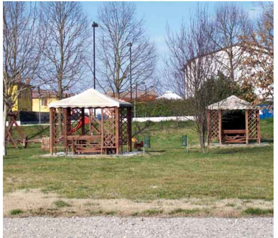
> Area feste a Codisotto

- contributo alla sezione “AVIS di Luzzara” in occasione della festa realiz-