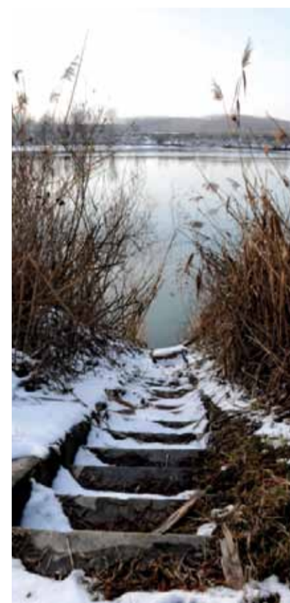
© Luzzara - Maria Lapenta, 2012 <

Il progetto, grazie alla collaborazione con il Colorclub Berlin-Treptow, propone infine una doppia visione del tema, accostando le immagini del paese Luzzara a quelle della metropoli Berlino. In un confronto fatto di rimandi che conferiscono rilievo alle minime variazioni, spazio, partecipazione e cittadinanza rivelano inaspettate affinità nella piazza comune della fotografia.