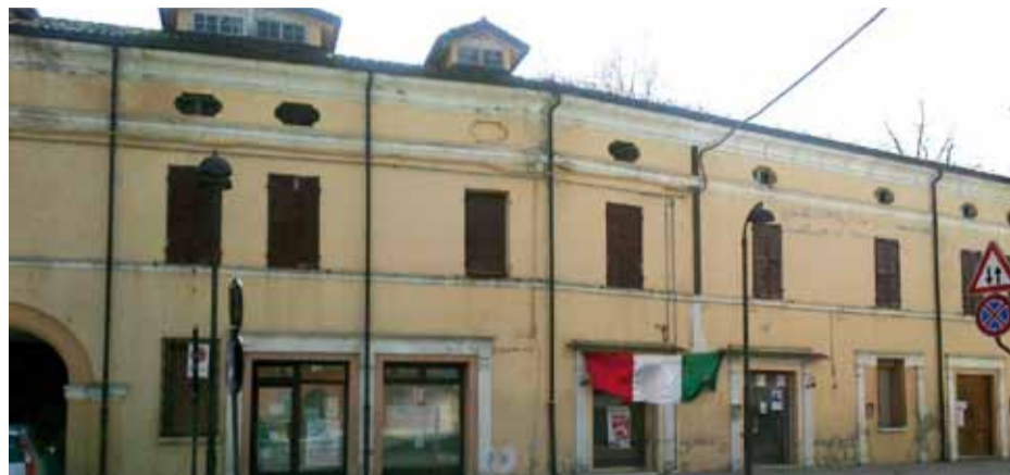
➤ L'ex casa di riposo di via Avanzi

1 milione e 700 mila euro a fondo perduto dalla Regione