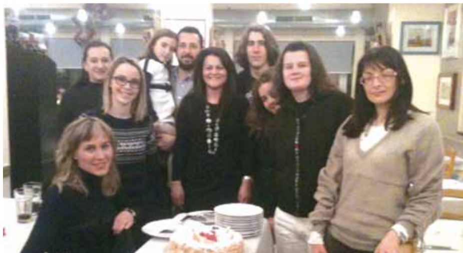
> Alcuni dipendenti comunali e rilevatori con il sindaco alla cena di "fine censimento"

Come lo hanno vissuto i rilevatori di Luzzara