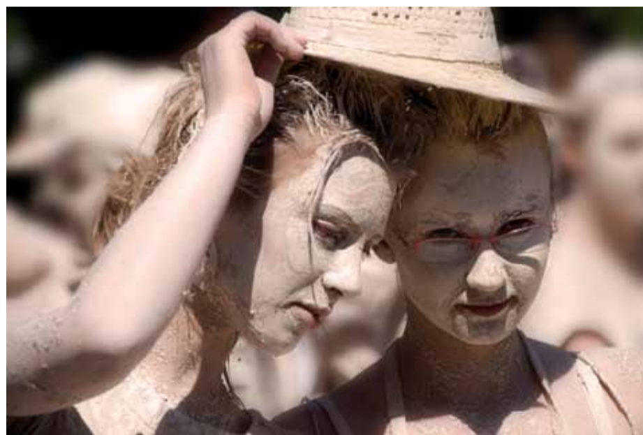
© Karneval, Berlin - Wolfgang Hiob, 2012 <

Il progetto, grazie alla collaborazione con il Colorclub Berlin-Treptow, propone infine una doppia visione del tema, accostando le immagini del paese Luzzara a quelle della metropoli Berlino. In un confronto fatto di rimandi che conferiscono rilievo alle minime variazioni, spazio, partecipazione e cittadinanza rivelano inaspettate affinità nella piazza comune della fotografia.