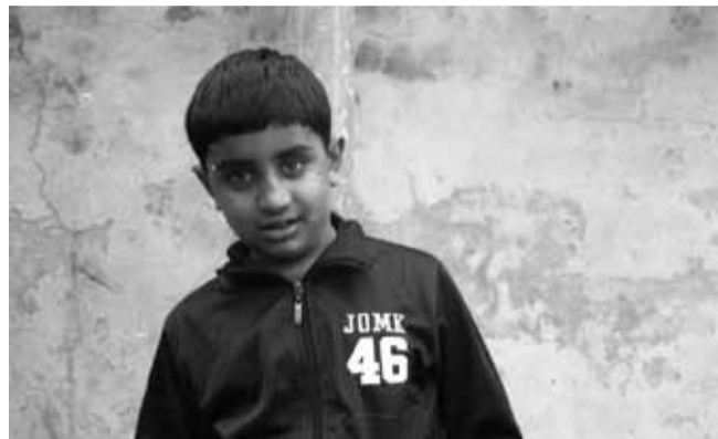
> © Luzzara Silvio D'Amico, 2012

Luzzara. Treptow. Non è difficile colmare tanta lontananza con similitudini. Le cassette basse a bordo strada, il fiume che le tocca entrambe e le va a costituire secondo natura, confinandole, l'attitudine marginale saldata da un carattere forte che si coglie subito. Luoghi per camminate notturne, concentrati nei pensieri solitari, con un accento sul lato lugubre che ne costituisce il fascino sottile. Due periferie, capaci di farsi centro. Questo per ribadire che ogni paese, anche il più remoto, non è mai solo al mondo. E non si può temere di essere attraversati. Luzzara. Popolazione: novemila uomini, e altrettante anime". (Massimo Zamboni, dall'introduzione al catalogo della mostra Piazza d'uomo )