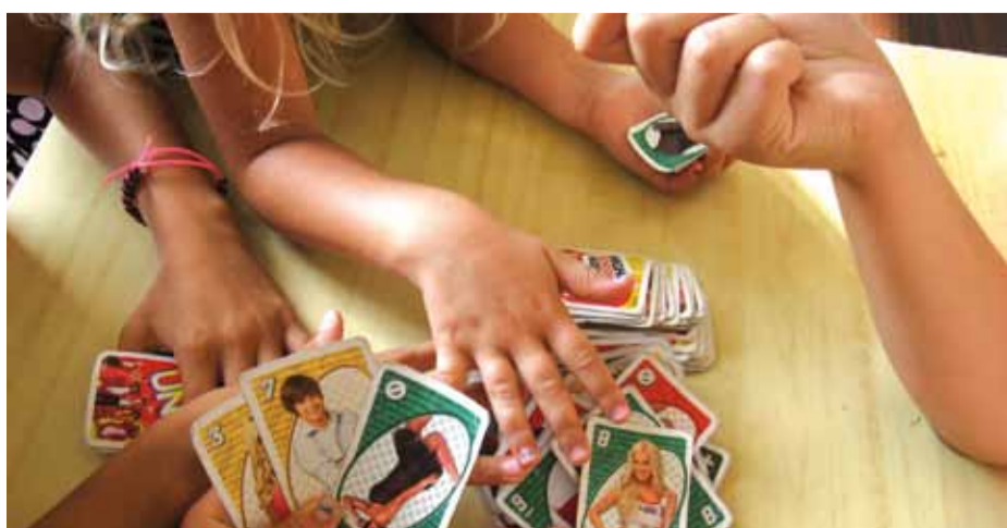
> Grest a Casoni

Informazioni e prenotazioni: 346 8876542