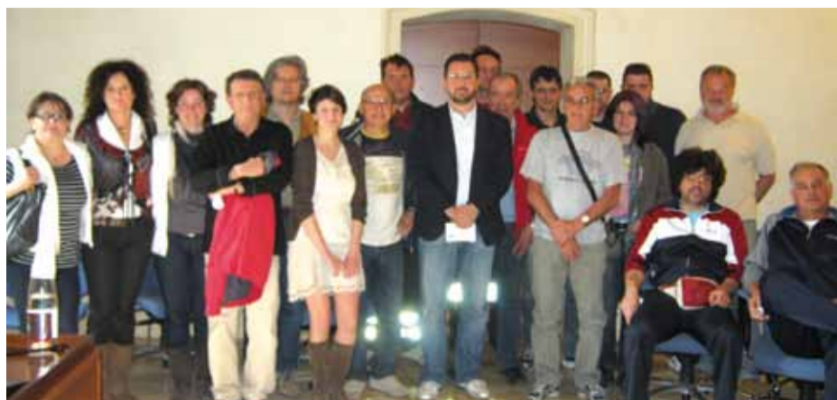
➤ Il Sindaco con i rappresentanti delle associazioni in Municipio per la presentazione del calendario eventi

Oltre 80 giorni di eventi in programma questa primavera - estate sul territorio luzzarese: si va da Artenatura, a Econotte alla Fiera di Luzzara, da Us Aquila For Africa alla Luzzara Cup e a Casoni a tutta birra. Oltre 300 i volontari coinvolti nell'organizzazione delle iniziative, per un programma che comprende sagre, manifestazioni, concerti, motoraduni, sport, a conferma dell'esistenza di una realtà luzzarese vivace e aggregante. Le nuove tecnologie diventano fondamentali per gestire una tale mole