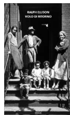
Volo di ritorno di Ralph Ellison

Tredici racconti di uno dei maestri della narrativa americana per la prima volta pubblicati in Italia. Ellison raccoglie qui le sue esperienze giovanili di quando era un ragazzo negro, povero ma con molti sogni, primo fra tutti quello di diventare un musicista jazz. Scritti fra il 1937 e il 1954 e raccolti in un volume postumo, questi racconti rappresentano il meglio della narrativa breve dello scrittore americano; racconti dove emergono le molte facce dell'America, il suo fascino e le sue contraddizioni. Storie di discriminazione e di violenza, ma anche di solidarietà, di opportunità colte e mancate, di riti di passaggio. Con uno stile di scrittura indimenticabile, sicuramente ai vertici della narrativa americana del Novecento.