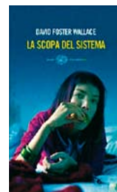
La scopa del sistema di David Foster Wallace

Tredici racconti di uno dei maestri della narrativa americana per la prima volta pubblicati in Italia. Ellison raccoglie qui le sue esperienze giovanili di quando era un ragazzo negro, povero ma con molti sogni, primo fra tutti quello di diventare un musicista jazz. Scritti fra il 1937 e il 1954 e raccolti in un volume postumo, questi racconti rappresentano il meglio della narrativa breve dello scrittore americano; racconti dove emergono le molte facce dell'America, il suo fascino e le sue contraddizioni. Storie di discriminazione e di violenza, ma anche di solidarietà, di opportunità colte e mancate, di riti di passaggio. Con uno stile di scrittura indimenticabile, sicuramente ai vertici della narrativa americana del Novecento.