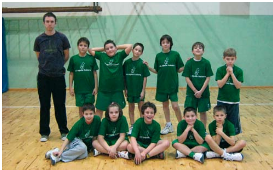
Due foto delle squadre MiniBasket