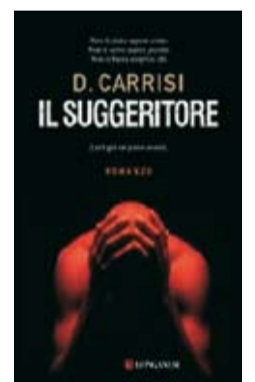
Il suggeritore di Donato Carrisi

"La scopa del sistema è una grandissima sorpresa, che si collega direttamente dalla tradizione dell'eccesso praticata da Pynchon o da Irving. La principale qualità di Wallace è la sua esuberanza: personaggi che sembrano cartoni animati, storie a incastro, coincidenze impossibili, un amore sincero per la cultura pop e soprattutto quello spirito giocoso e quell'umorismo che sembrano scomparsi dalla maggior parte della narrativa più recente" (The New York Times Book Review). Subito dopo la notizia del suicidio di Wallace, avvenuto nel settembre scorso, Einaudi ha ripubblicato La scopa del sistema , che nel 1987 aveva rivelato la nascita di un talento straordinario e di una figura di culto: la voce più originale, coraggiosa e innovativa del nuovo romanzo americano.