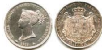
2 lire del 1815 del Ducato di Parma Piacenza e Guastalla. Sul diritto testa diadematata di Maria Luigia Principessa Imperatrice d'Austria. Sul rovescio stemma sormontato da corona.

http://numismatica.deiducati.altervista.org