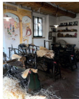
Museo del Truciolo

L a tradizione ci sta a cuore! Non è una frase fatta, ma un impegno concreto. Crediamo che sperimentare "le cose di una volta" sia un valore da coltivare e da non relegare tra ricordi nostalgici. Noi del Museo del Truciolo lo dimostriamo con la nostra attività gratuita rivolta a scuole e a gruppi, con l'apertura domenicale per insegnare a far la treccia e non solo. Quest'anno qualcosa bolle in pentola! Vorremmo coinvolgere insieme genitori e figli, nonni e nipoti, dando l'opportunità di conoscere i giochi di una volta .