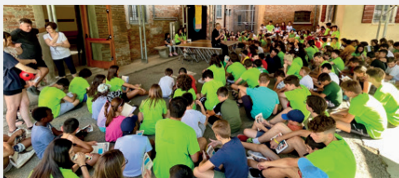
Il Grest a Luzzara

A Luzzara sono stati attivati i servizi estivi di nido e scuola dell'infanzia "Estate giocando" e il Grest della Parrocchia, che conta 115 iscritti e 70 tra animatori ed educatori. Centri estivi della parrocchia anche a Codisotto e a Villarotta, mentre a Casoni sono gestiti dal Centro Sociale. A Villarotta seguirà il campo sportivo di A.S. Gymnasium.