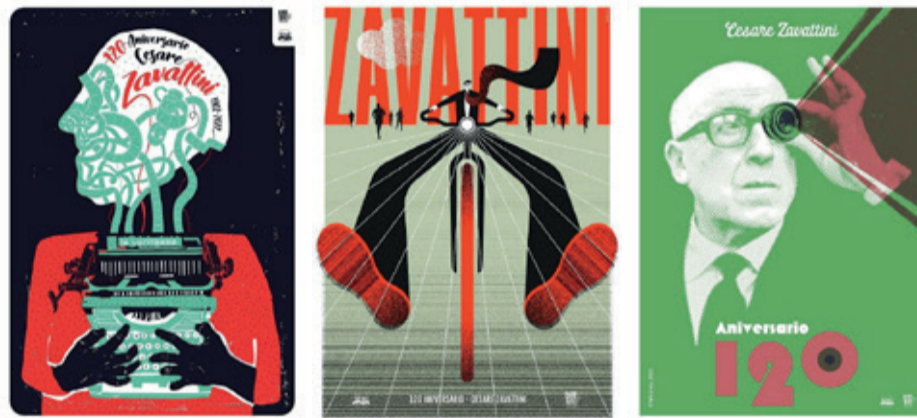
Alcuni dei manifesti finalisti del concorso promosso da CartelON. Gráfica Cubana

N el mese scorso abbiamo avuto l'onore di partecipare a Orizzonti Italia-Cuba , Festival interculturale dedicato al cinema e all'audiovisivo italiano e cubano, che si è tenuto a L'Avana dal 4 all'11 giugno . Invitati dalla direzione artistica formata da Luis Ernesto Doñas e Simone Faucci, è stata un'importante occasione di incontro e di dialogo che ci ha messo a confronto con diverse esperienze e realtà pionieristiche sul tema dei linguaggi della contemporaneità. Un invito a cui non potevamo mancare: questa prima edizione ha infatti reso omaggio a Cesare Zavattini in occasione del 120° anniversario della nascita. Se, come sappiamo, Za è stato il vero e proprio "padre" del Neorealismo, collaboratore storico di Vittorio De Sica e fonte d'ispirazione per il cinema italiano prima e mondiale poi, meno noto è il fatto che Zavattini può essere considerato anche "il padre ispiratore" dei primi grandi registi cubani. Fu a Cuba nella prima settimana del cinema italiano nel '53 dove conobbe alcuni giovanissimi cineasti, poi tornò all'indomani della Rivoluzione per un ultimo fondamentale soggiorno (1959-1960), dove lavorò per tre mesi alla nascita della nuova cinematografia cubana e fu lo sceneggiatore di uno dei primi film prodotti dall'ICAIC. È attraverso Zavattini che Orizzonti Italia-Cuba ha voluto rafforzare il