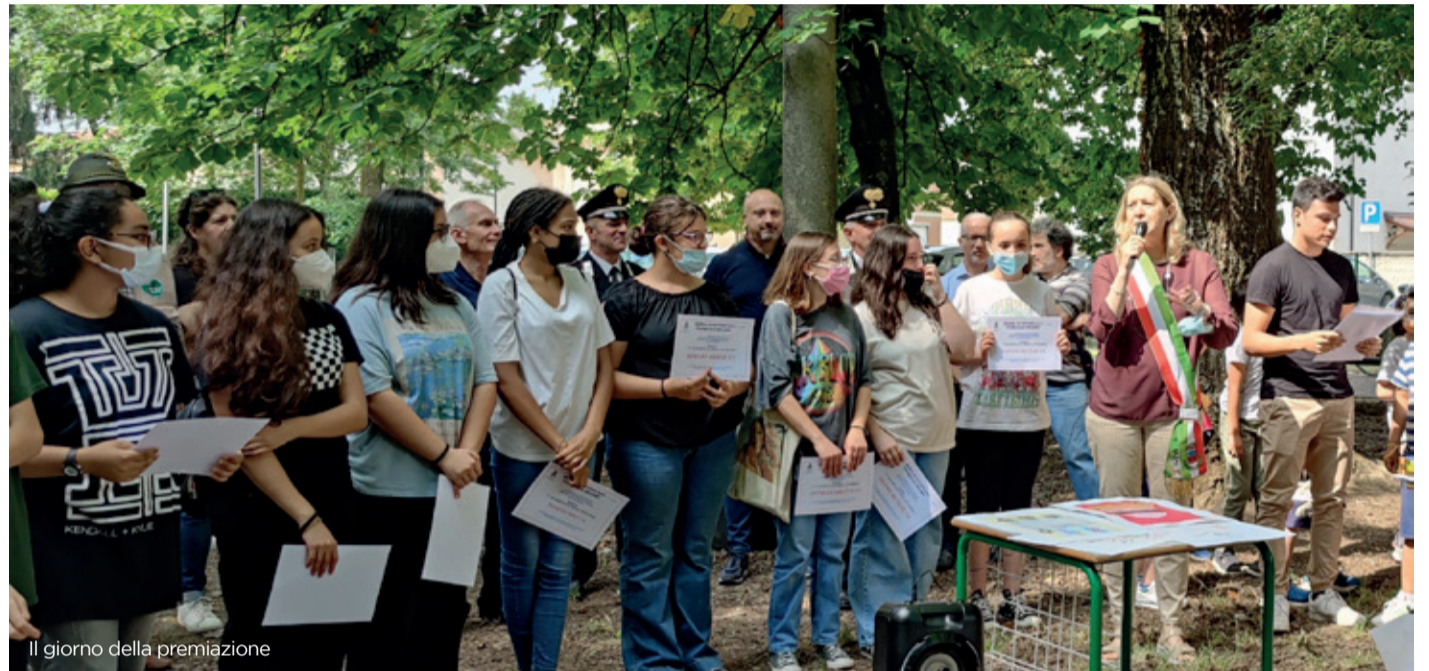
Il giorno della premiazione