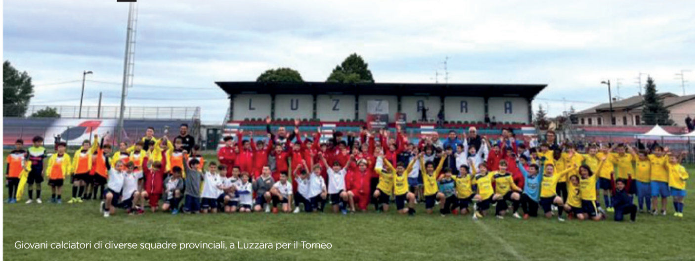
Giovani calciatori di diverse squadre provinciali, a Luzzara per il Torneo

UNIVERSITÀ DEL TEMPO LIBERO DI VILLAROTTA E LUZZARA