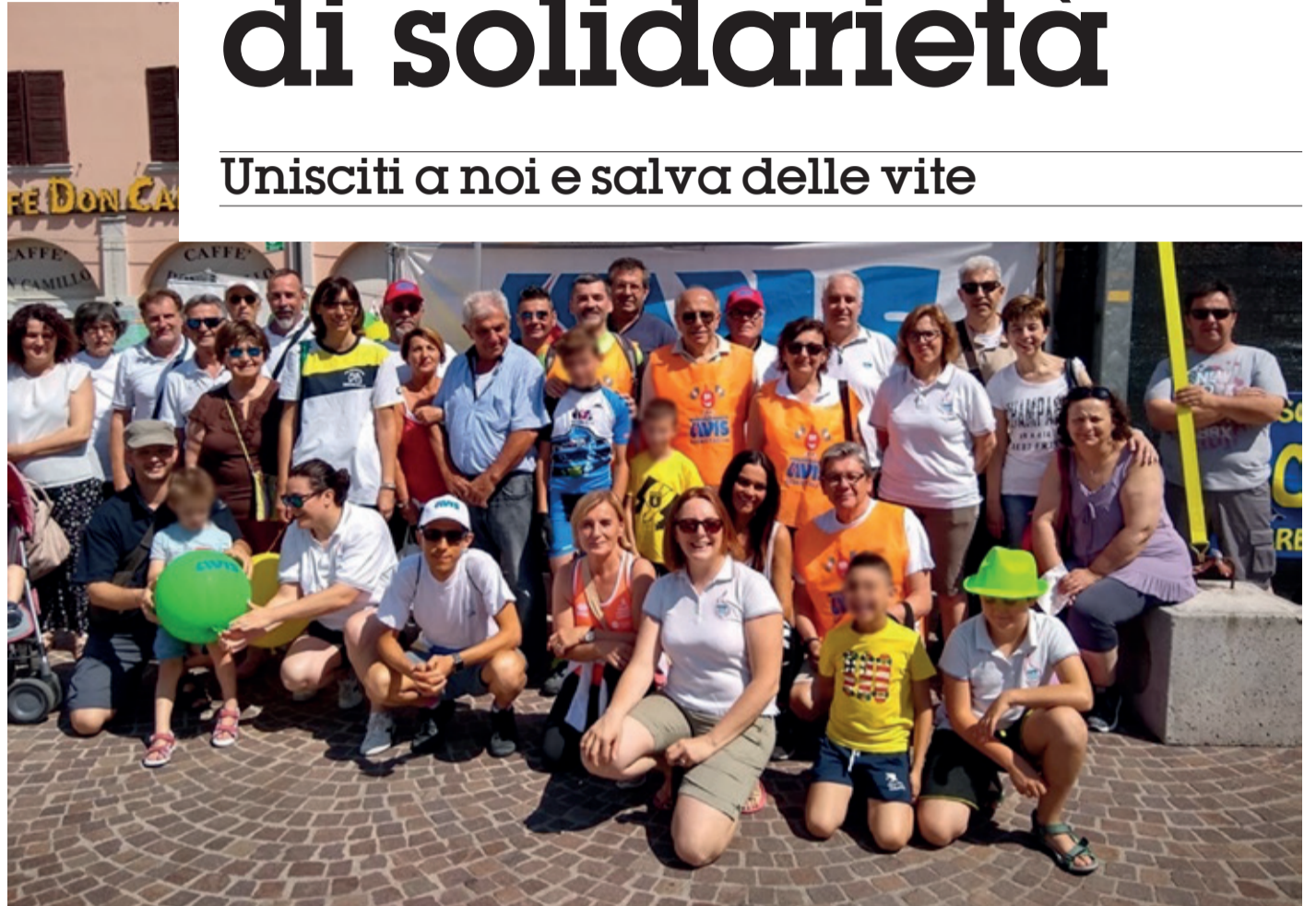
Una delle ultime feste del donatore organizzata da Avis comunale di Luzzara ODV con le Avis bassa reggiana - Brescello 2019

Gianluca Gozzi Avis comunale di Luzzara ODV