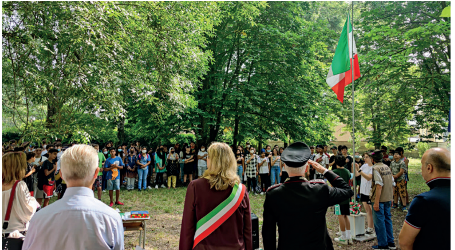
Sabato 4 giugno si è svolta la cerimonia di premiazione delle borse di studio in memoria del Brigadiere Capo Pasquale Iscarò

12 ESTATE A LUZZARA Gli appuntamenti da non perdere