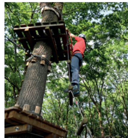
Il River Park della golen di Luzzara

Oltre a proporre spunti per gli appassionati della due ruote ecologica, il percorso “BI-CI-BO” intende valorizzare anche molte altre attività da praticare all'aria aperta, magari partendo proprio dalla Golen: camminate, nordic walking, canoa, equitazione e l'imperdibile River Park situato proprio a Luzzara, unico parco avventura di questo genere in tutto il territorio della Bassa.