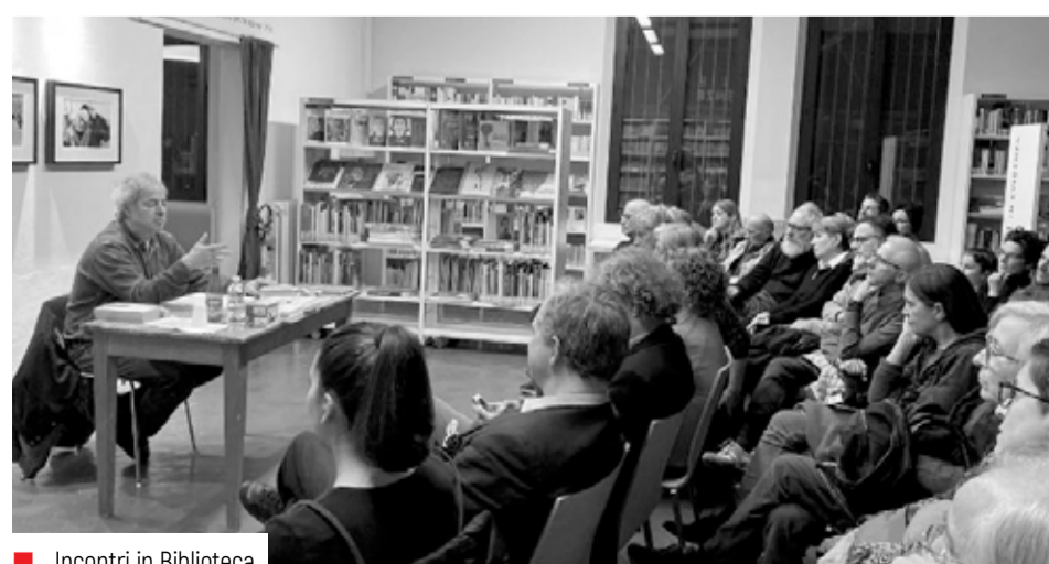
Incontri in Biblioteca.