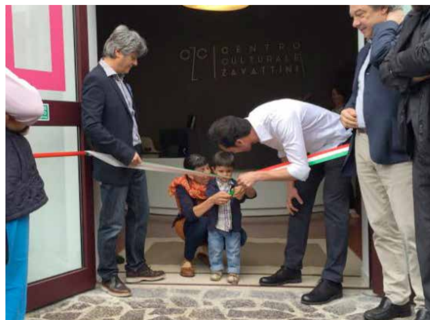
L'inaugurazione del Centro Culturale Zavattini nel 2015.