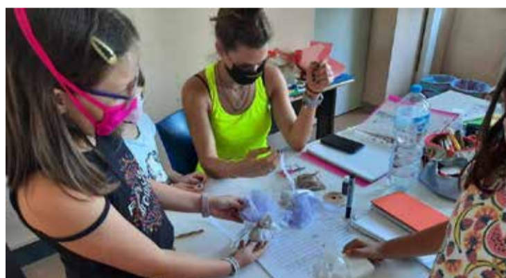
■ I campi gioco organizzati questa estate in sicurezza