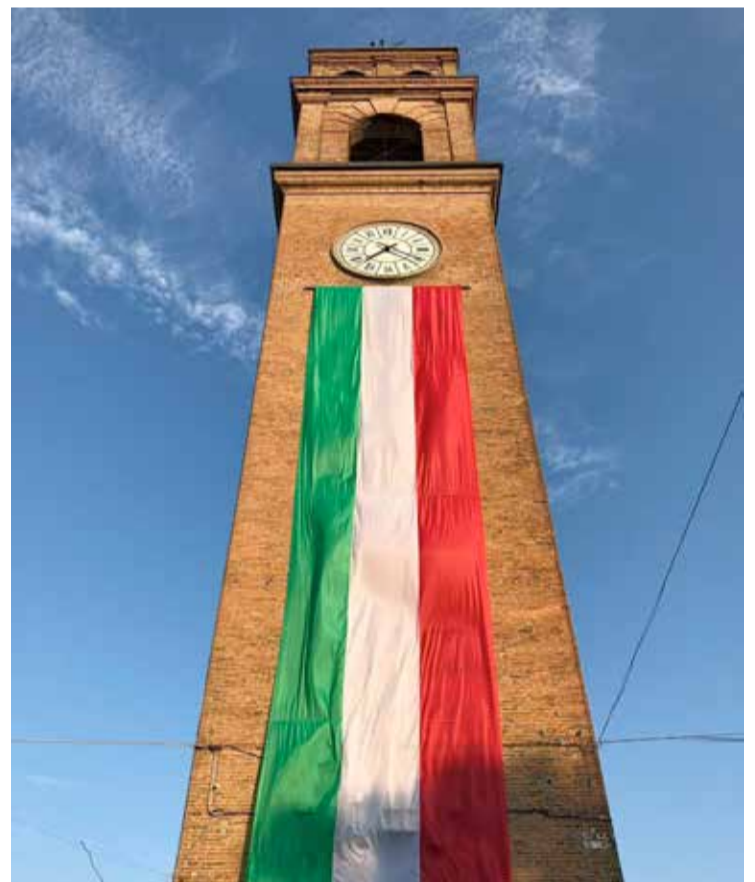
■ In occasione della Festa della Repubblica, lungo tutta l'altezza della Torre Civica di Luzzara, è stata dispiegata la bandiera tricolore.