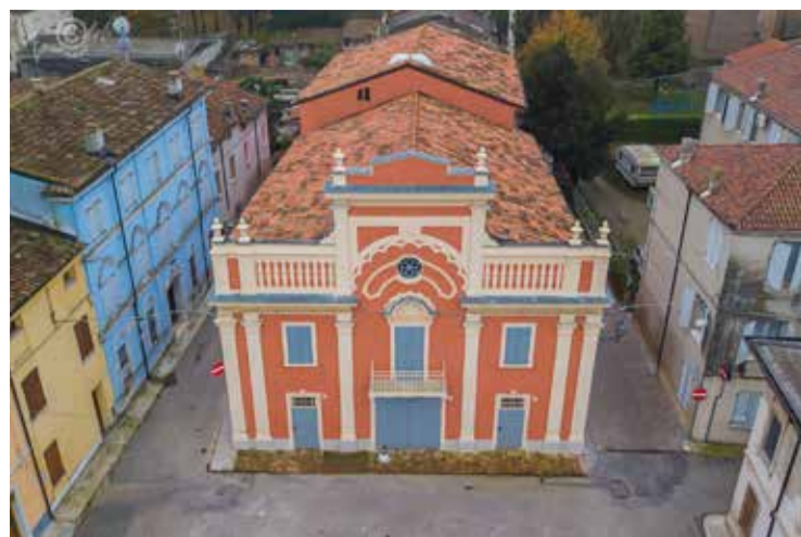
■ Il teatro ristrutturato visto dall'alto