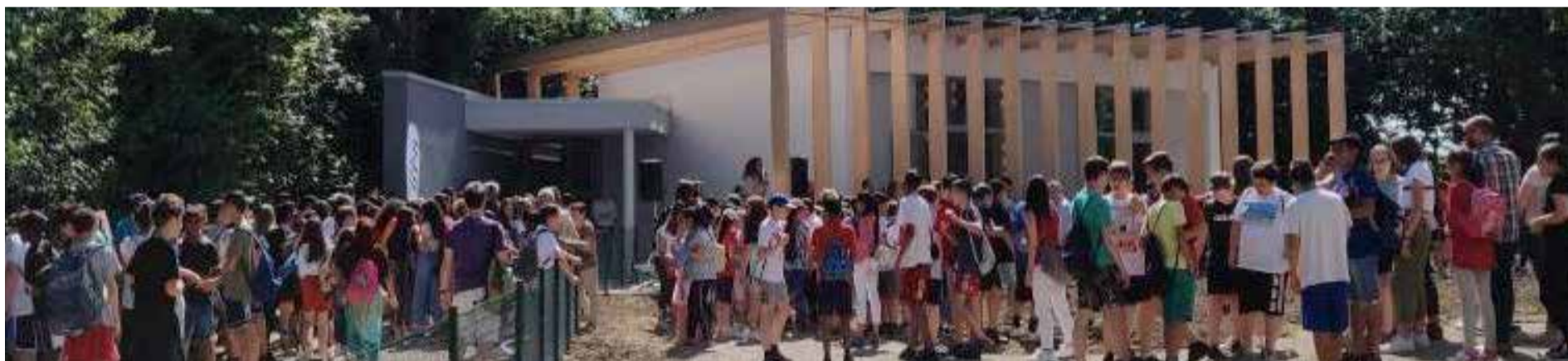
■ Inaugurazione dello Spazio Goccia

ché ai dipendenti comunali; ■ installazione, nei pressi del distributore di acqua pubblica, di una colonnina elettrica ENEL X per la ricarica dell'auto ; ■ partecipazione al Banco Atersir 2020 per la riduzione dei rifiuti da monouso e incentivo alle pratiche di riciclo e riuso; ■ adesione al nuovo PAESC 2030 tramite "Patto dei Sindaci" , redatto a livello Unionale, per il monitoraggio e il miglioramento delle politiche energetiche locali, per rispettare l'obiettivo di riduzione delle emissioni di CO2 come risposta ai cambiamenti climatici in atto (il precedente PAESC "Piani d'Azione per l'Energia Sostenibile" aveva l'obiettivo ridurre le emissioni e gli sprechi entro il 2020).