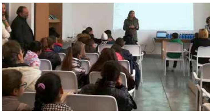
■ La distribuzione delle borracce ai rappresentanti dell'Istituto Comprensivo. La Sindaca spiega agli studenti le ragioni dell'iniziativa.

comuni dell'Unione Bassa Reggiana, con fotografie aeree e droni, e richiesta ai proprietari di rimuovere l'amianto oppure ordinanza di rimozione o incapsulamento in caso di pericolo; attivazione con SABAR del "kit domestico Amianto" per la rimozione a costi contenuti di piccole porzioni; ■ apertura dello 'Spazio goccia' , spazio didattico presso l'acquedotto di Luzzara con la collaborazione di Iren, Comune di Luzzara, Fondazione Un Paese e Azienda Servizi Bassa Reggiana. Si tratta di uno spazio aperto alle scuole di tutta la Provincia e ai cittadini che propone laboratori e attività culturali sul tema dell'acqua; ■ rinnovata la convenzione con il canile intercomunale di Novellara , che include anche la disponibilità di veterinari per la sterilizzazione di gatti delle colonie feline ; rinnovata la convenzione con i veterinari del territorio per le colonie gestite da volontari; ■ ripiantumazione di viale Zavattini (già viale Po) con pioppi cipressini, che hanno