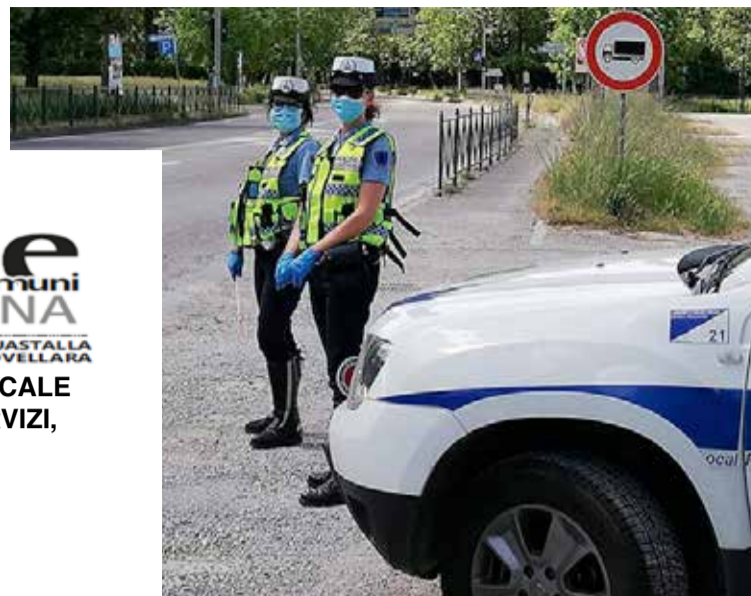
■ Nelle foto, attività di presidio del territorio.

unione dei Comuni BASSA REGGIANA BORETTO - BRESCELLO - GUALTIERI - GUASTALLA LUZZARA - REGGIOLO - POVIGLIO - NOVELLARA CORPO UNICO DI POLIZIA LOCALE UOC SUB-AMBITO NORD, SERVIZI, POLIZIA GIUDIZIARIA