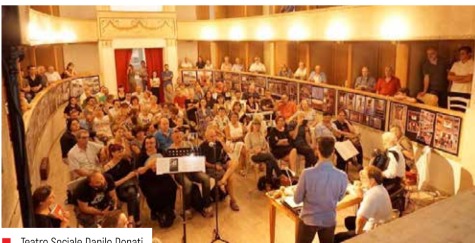
Teatro Sociale Danilo Donati.

rie di mostre e incontri con critici e fotografi, grazie alla collaborazione creata tra il 2013 e il 2014 con il Philadelphia Museum of Art ha sviluppato una nuova fase progettuale che ha sancito un rilancio ulteriore della sezione fotografica gestita da Fondazione Un Paese, inaugurando una serie di eventi ed iniziative di particolare rilievo: itinerari e percorsi per il paese e visite guidate sui luoghi fotografati da Strand, Gianni Berengo Gardin, Stephen Shore e tanti altri; workshop, incontri e corsi di fotografia, per adulti e ragazzi; richieste di collaborazione da parte di enti che si occupano di fotografia, mostre con le fotografie di Hazel Kingsbury Strand, che lavorò insieme al marito per Un paese , patrimonio da noi conservato e presente con due immagini nel catalogo della mostra americana.