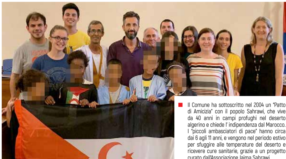
■ Il Comune ha sottoscritto nel 2004 un "Patto di Amicizia" con il popolo Sahrawi, che vive da 40 anni in campi profughi nel deserto algerino e chiede l'indipendenza dal Marocco. I "piccoli ambasciatori di pace" hanno circa dai 6 agli 11 anni, e vengono nel periodo estivo per sfuggire alle temperature del deserto e ricevere cure sanitarie, grazie a un progetto curato dall'Associazione Jaima Sahrawi.

Il progetto è coordinato dall'associazione Jaima Sahrawi di Reggio Emilia, e coinvolge anche altri Comuni. Durante la loro permanenza, i bambini sono sottoposti a uno screening sanitario completo, ed eventuali interventi necessari sono coperti grazie all'intervento attivo della Regione Emilia Romagna, che da anni è al fianco del popolo Sahrawi nella sua legittima lotta di autodeterminazione. Il progetto vuole poi offrire ai giovani sahwari un'esperienza di vacanza all'estero