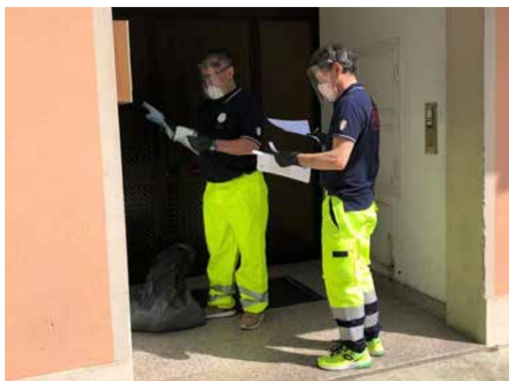
■ L'Associazione di protezione civile Antenna Amica ha distribuito le mascherine alla popolazione