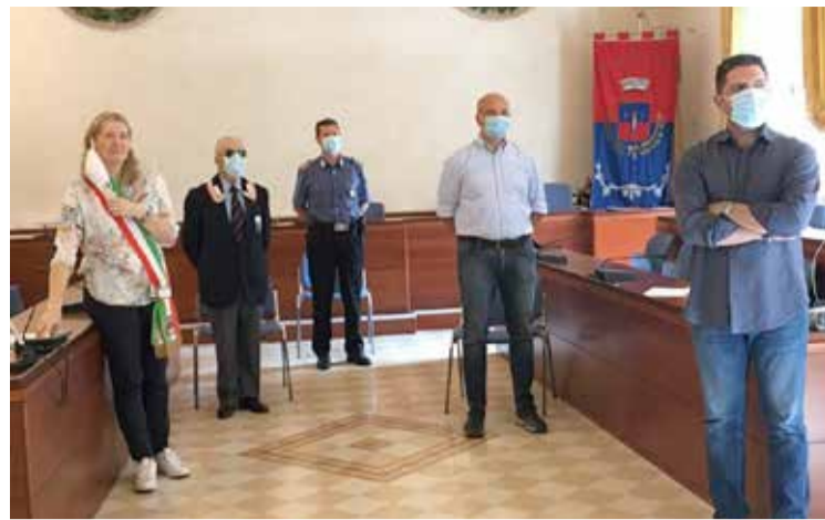
■ Nelle foto la cerimonia del Premio Iscaro, che si è svolta quest'anno online su Google Meet, con i rappresentanti delle istituzioni collegati dalla sala consiliare

L'eccezionalità della composizione demografica che nei primi anni Duemila ha caratterizzato la formazione delle classi e delle sezioni, oggi si deve ritenere pressoché ordinaria in confronto alle realtà dei paesi a noi vicini e ai flussi migratori nelle nostre zone. Questo però non significa negare le criticità così come le opportunità che debbono essere parimenti colte ed è per questo che l'impegno dell'Amministrazione è continuato come e più di allora, garantendo sempre la mediazione culturale e linguistica. In particolare si ricordano: