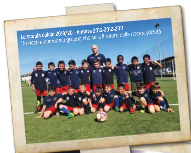
La scuola calcio 2019/20 - Annate 2013-2012-2011 Un ricco e numeroso gruppo che sarà il futuro della nostra società