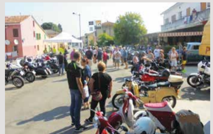
■ Motoincontro a Codisotto 2018