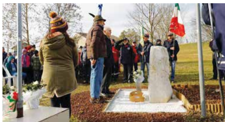
■ Giornata della Memoria al parco di via San Martino