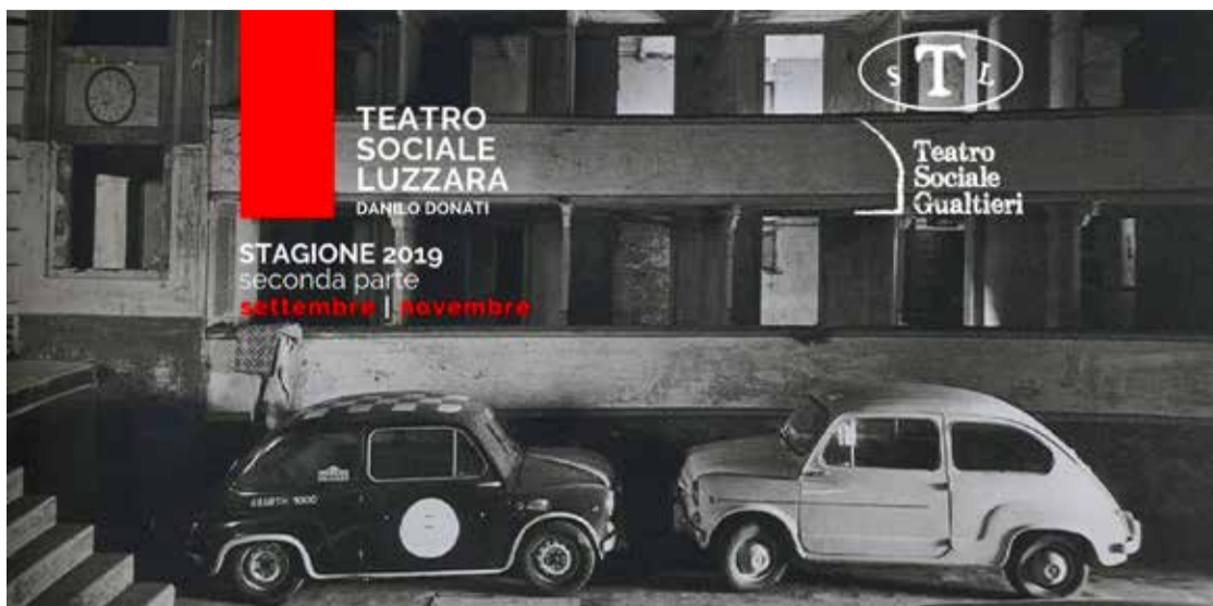
© fotografia di Gianni Berengo Gardin, Un paese vent'anni dopo , 1976

I l Teatro Sociale di Gualtieri quest'anno ai primi d'agosto chiuderà per un po'. Niente di grave, anzi. Amministrazione Comunale e Associazione hanno programmato un doppio cantiere per il miglioramento sismico delle strutture e la riqualificazione del graticcio storico. Il teatro riaprirà più bello di prima nella primavera del 2020.