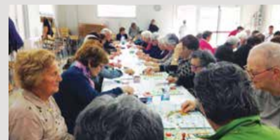
■ Progetto collettivo "Filos"

La nostra base è lo sportello di via Filippini 65. Lì sono arrivate molte richieste, relative a tante esigenze differenti. Quali? I trasporti di persone anziane autosufficienti non automunite con necessità di raggiungere farmacie, ambulatori, ospedali per visite mediche, in primis. Ma non solo: hanno chiesto aiuto famiglie in difficoltà nell'accompagnare con continuità i figli alle strutture per terapie e riabilitazioni; a volte per problemi con mezzi propri, a volte per le distanze. Da alcuni mesi, per rispondere con maggior efficacia e tempestività alle richieste sempre più numerose, ci siamo attivati per poter disporre nel più breve tempo possibile di un automezzo attrezzato con pedana elevatrice per il trasporto di persone con ridotta capacità motoria . Lo abbiamo fatto con il sostegno e il patrocinio gratuito del Comune di Luzzara e attraverso il contributo di generose aziende del territorio. Il veicolo, che a breve verrà consegnato e che sarà a disposizione della Comunità, presenterà all'esterno i loghi delle aziende che avranno sostenuto questo progetto attraverso il loro contributo. Noi, già da ora, le vogliamo ringraziare. Siamo felici di constatare che la nostra rete sul territorio si sta ampliando: noi volontari ANTEAS stiamo collaborando con il Comune di Luzzara, con l'Istituto Comprensivo Scolastico, con la Parrocchia, la Caritas, l'ASP, l'AUSER e con "Noi di Luzzara" . E siamo aperti a tutte le altre associazioni del