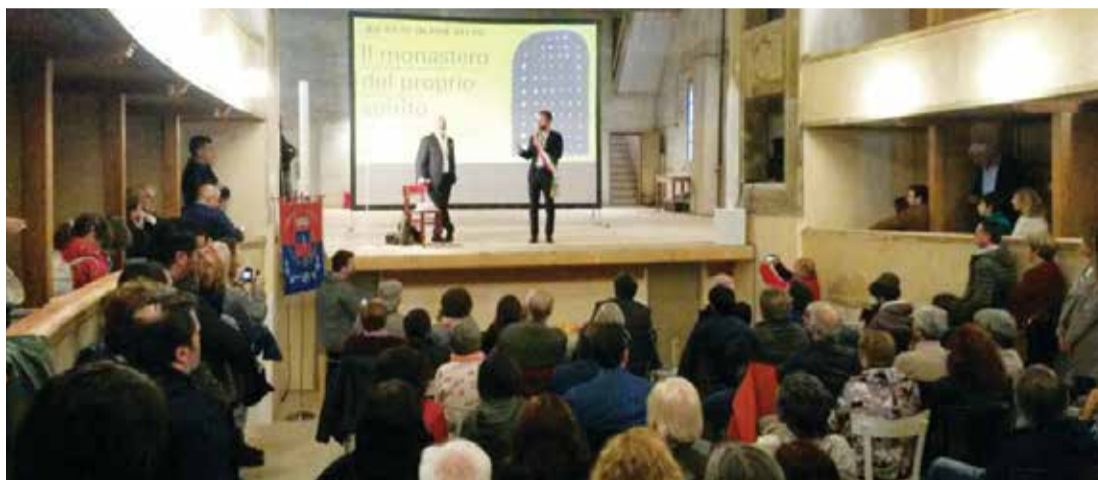
■ Il Sindaco sul palco il 6 ottobre scorso, giorno dell'inaugurazione dopo i restauri

I contributi in arrivo con il secondo bando, pari a 13 mila euro, sono stati destinati all'acquisto di attrezzature audio e luci, così da avere una strumentazione fissa a disposizione in teatro e poter così affittare lo spazio anche a privati per incontri e convegni.