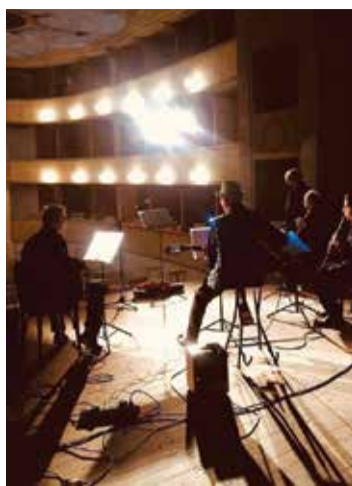
■ Spettacolo "Il violino ritrovato"