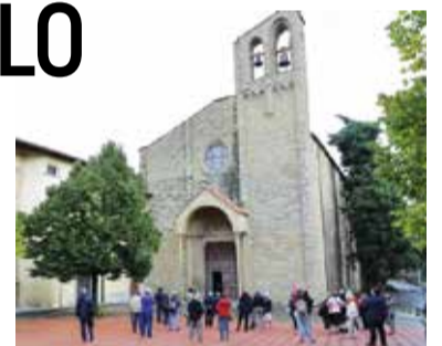
■ Gita ad Arezzo