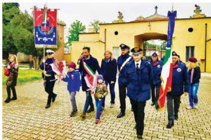
■ Giro dei cippi del 14 aprile

tagne dove caddero i partigiani, nelle carceri dove furono imprigionati, nei campi dove furono impiccati. Dovunque è morto un italiano per riscattare la libertà e la dignità, andate lì, o giovani, col pensiero, perché lì è nata la nostra Costituzione". Le nostre attività sono proseguite con la distribuzione