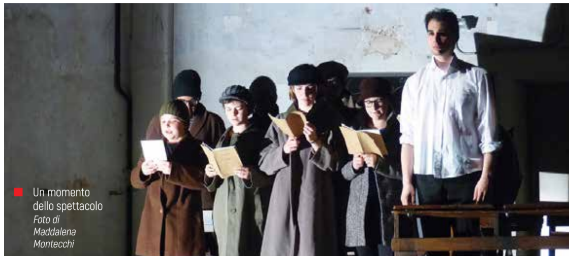
■ Un momento dello spettacolo