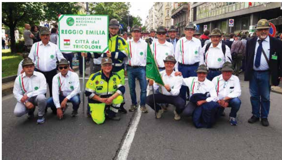
■ Il gruppo Valgranda all'Adunata Nazionale degli Alpini a Milano

L'adunata nazionale degli alpini, che si è svolta dal 10 al 12 maggio scorso a Milano, è stata un'edizione molto speciale dell'Adunata, perché ha celebrato il centenario della fondazione dell'Ana (Associazione Nazionale Alpini), nata proprio a Milano.