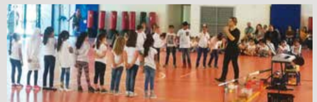
■ Scuola primaria di Villarotta, 1-6-2019