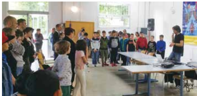
■ Progetto Musica in classe

A conclusione del progetto di musica presente da tre anni alla scuola primaria, sabato 18 maggio ha avuto luogo nella Sala Civica un open day, durante il quale i genitori, presenti in gran numero, seduti accanto ai propri figli, hanno avuto l'opportunità di assistere ad una lezione tipo di 45 minuti per classi parallele.