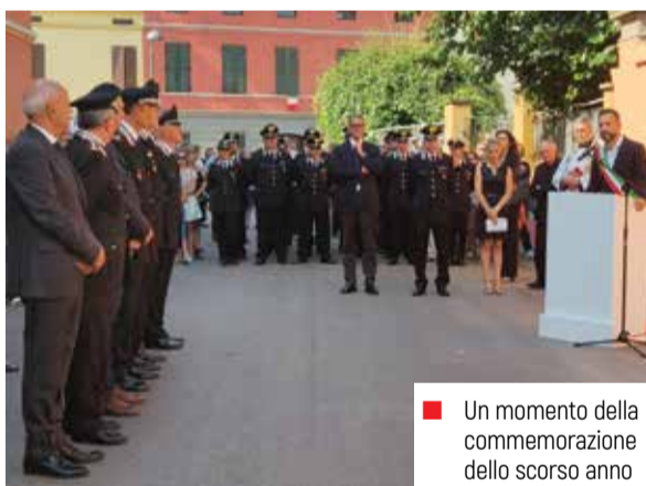
■ Un momento della commemorazione dello scorso anno

Tutti i cittadini sono invitati a partecipare alla cerimonia del 27 luglio prossimo a cui parteciperanno alte cariche militari e autorità locali e a esporre la bandiera tricolore.