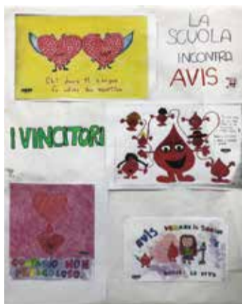
■ Vincitori del concorso di disegno classi quinte scuola primaria

no 2019, ha intrapreso un percorso formativo rivolto alle scuole del comune.